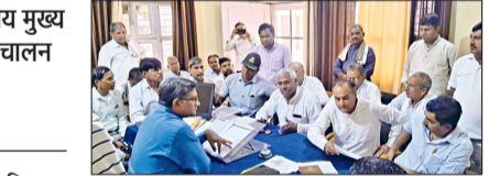
महेंद्रगढ़। कार्यकारी अभियंता से बात करते कर्मों।