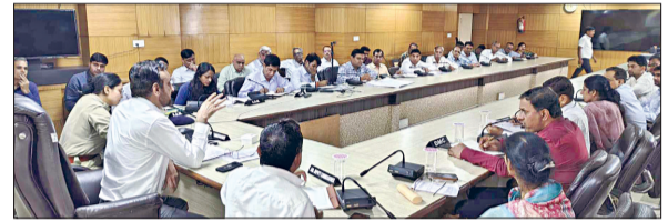
नारनौल। अधिकारियों की बैठक लेते डीसी कैप्टन मनोज कुमार।

31 अक्टूबर को रन फॉर यूनिटी व 1 नवंबर को निकाली जाएगी राष्ट्रीय पदयात्रा हरिभूमि न्यूज | नारनौल