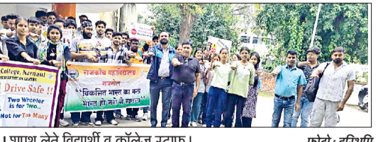
नारनौल। शपथ लेते विद्यार्थी व कॉलेज स्टाफ।