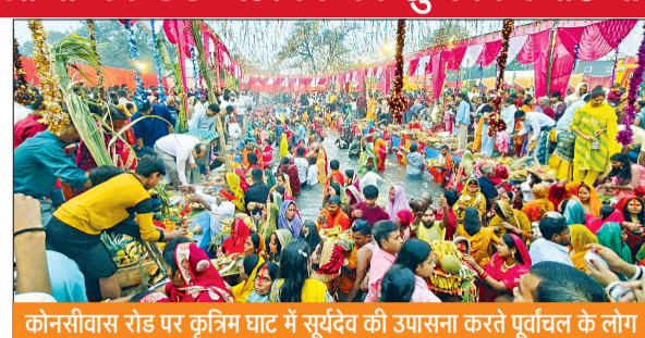
कोनसीवास रोड पर कृत्रिम घाट में सूर्यदेव की उपासना करते पूर्वाचल के लोग