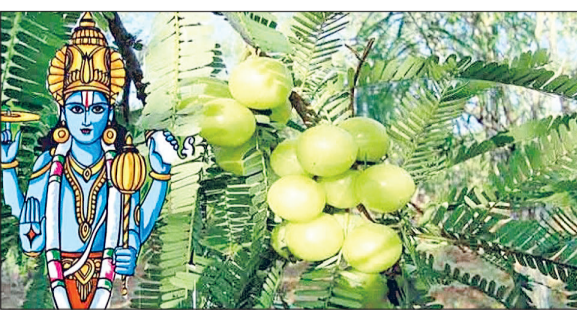
रेवाड़ी। 31 अक्टूबर को मनाई जाएगी आंवला नवमी।

भगवान विष्णु व माता लक्ष्मी को समर्पित आंवला नवमी का पर्व 31 अक्टूबर को विधि विधान से मनाया जाएगा। आंवला नवमी को अक्षय नवमी भी कहा जाता है। ज्योतिषाचार्यों का कहना है कि कार्तिक माह के शुक्ल पक्ष की नवमी 30 अक्टूबर को सुबह 10