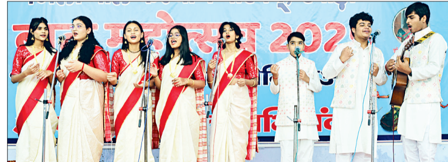
रेवाड़ी। देशभक्ति समूहगान पेश करते हुए टीम।