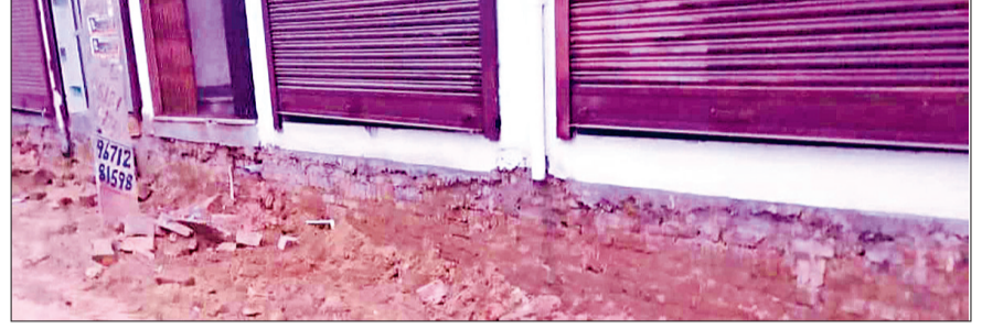
महेंद्रगढ़। नगर पालिका द्वारा तोड़े गए चबूतरे।

मार्ग पर अनेक दुकान और राजकीय महाविद्यालय, महिला कॉलेज, लघुसचिवालय जाने को यह मार्ग है छोटा