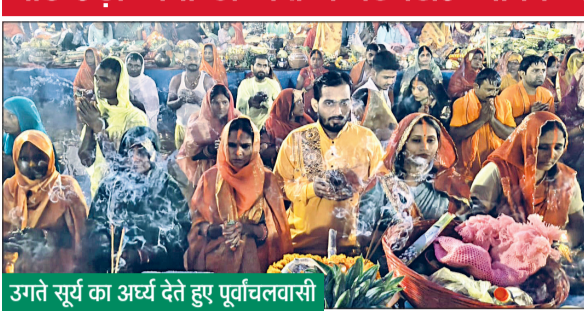
उगते सूर्य का अर्घ्य देते हुए पूर्वाचलवासी