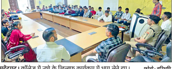
महेंद्रगढ़। कॉलेज में नशे के खिलाफ कार्यक्रम में भाग लेते हुए।

नशा मुक्ति एवं सतर्कता जागरूकता सप्ताह के अंतर्गत कार्यक्रम आयोजित हरिभूमि न्यूज | महेंद्रगढ़